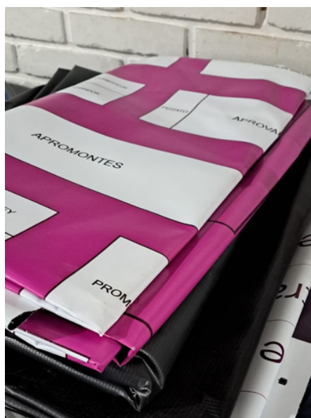
IMAGEM 1: BANNERS RECEBIDOS.