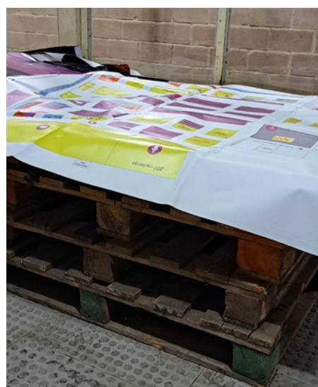
IMAGEM 2: BANNERS SOBRE A CAMA DE ARMAZENAMENTO — PRÉ-CONFECÇÃO DE PRODUTOS.